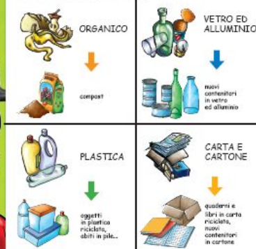
Pieghevole interno "L'ecopagella di Capitan Eco" f.to A4, 4 col., 2 ante, 130 gr