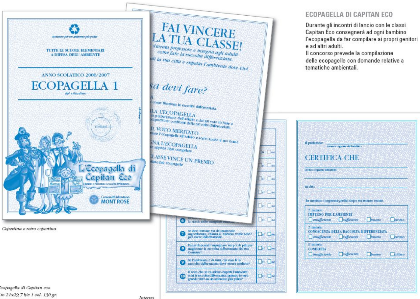
Copertina e retro copertina