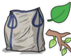
RACCOLTA SFALCI E RAMAGLIE