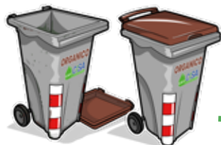
CONSEGNA E SOSTITUZIONE ATTREZZATURA