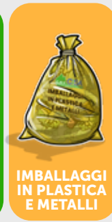
IMBALLAGGI IN PLASTICA E METALLI