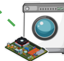
RITIRO INGOMBRANTI E RAE