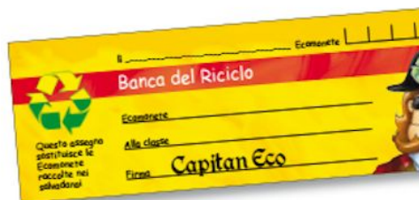
Ecoassaggi f.to 14x5 cm, 4+0 col., solo fronte, carta ricic

Le locandine riporteranno: il regolamento del gioco e la data di scadenza.