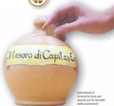
Salvadanaio in terracotta (uno per classe) per la raccolta delle ecomonete